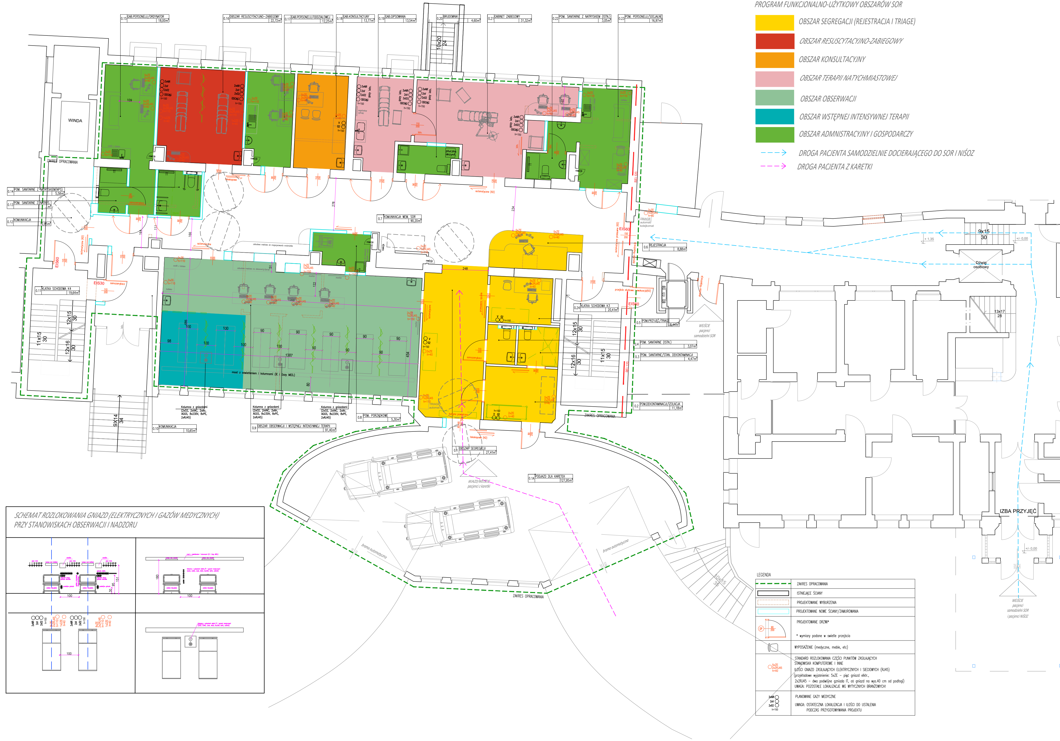
SCHEMAT ROZŁOKOWANIA GNAZD (ELEKTRYCZNYCH I GAZÓW MEDYCZNYCH) PRZY STANOWISKACH OBSERWACJI I NADZORU