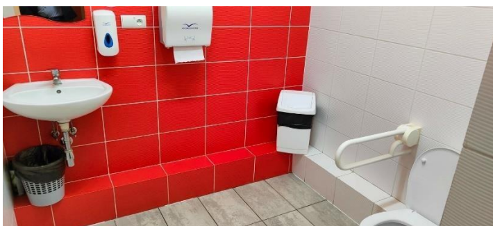
Zdjęcie nr 11: toaleta (umywalka)