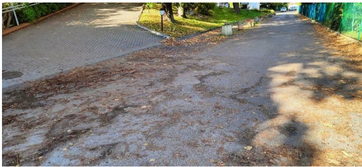
Zdjęcie nr 2: dojście do przychodni 2