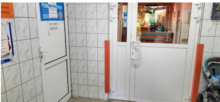
Zdjęcie nr 4: przedsionek i wejście do rejestracji