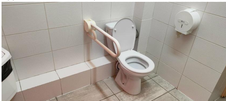
Zdjęcie nr 12: toaleta (miska ustępowa)