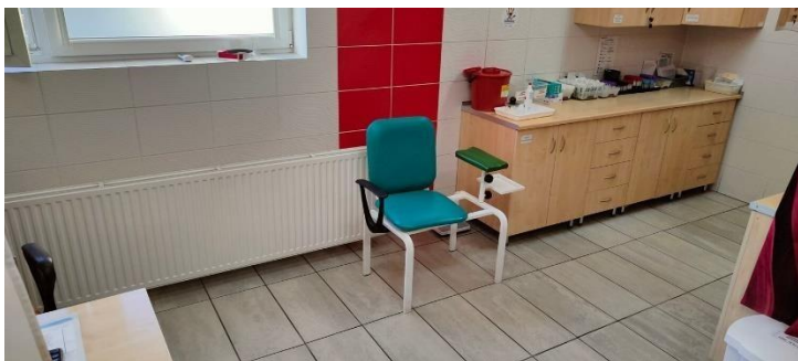
Zdjęcie nr 10: gabinet zabiegowy nr 2