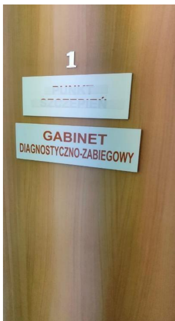
Zdjęcie nr 13: oznaczenia drzwi gabinetów