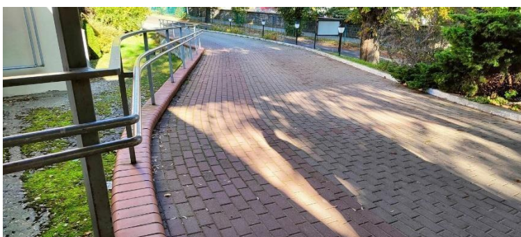
Zdjęcie nr 1: dojście do przychodni 1

Przychodnia zlokalizowana jest na jednej kondygnacji, posiada dwa wejście dla pacjentów (jedno przez recepcję, drugie wejście od strony szpitala). Widoczne są oznaczenia drogi ewakuacji. Personel jest przeszkolony.