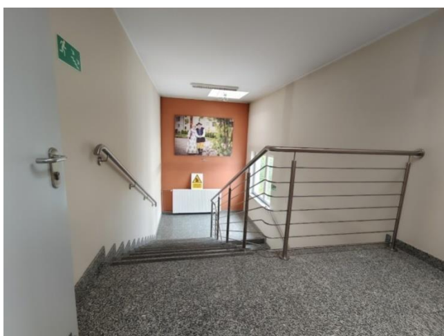
Zdjęcie nr 2: Klatka schodowa na której brak jest poręczy na dwóch wysokościach.