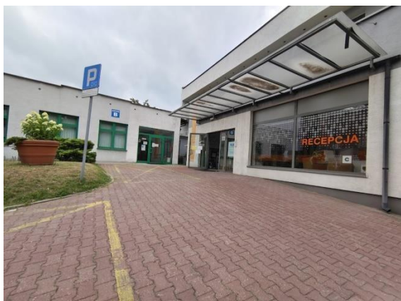
Zdjęcie nr 3: Wejście główne do obiektu, znajdujące się na przewyższeniu.