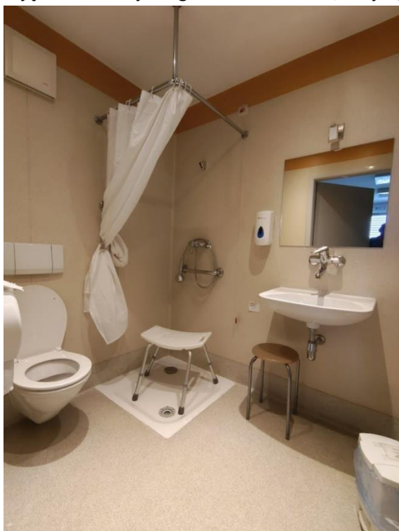
Zdjęcie nr 4: Oddziałowa łazienka oraz prysznic przystosowany dla osób na wózkach.